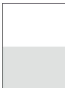
1/2 11 x 20,5 cm